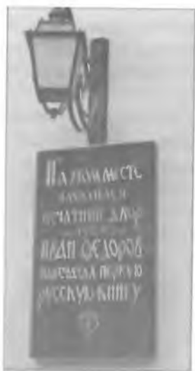
Мемориальная доска на месте бывшего Печатного двора в Москве

В 1553 г. при обстоятельствах, до конца неизвестных, в Москве была отпечатана первая русская книга — Евангелие, спустя некоторое время вышла в свет «Триодь полостная». Первопечатники издавали их за свой счет, на свой страх и риск, при благожелательном нейтралитете верховной власти. Вскоре правительство стало оказывать покровительство типографии, однако регулярная работа печатного станка началась спустя десять лет. Иван Федоров, ученик западных мастеров и первых славянских просветителей, исправляя непонятные места в Священном Писании, делал его доступным для русского читателя.