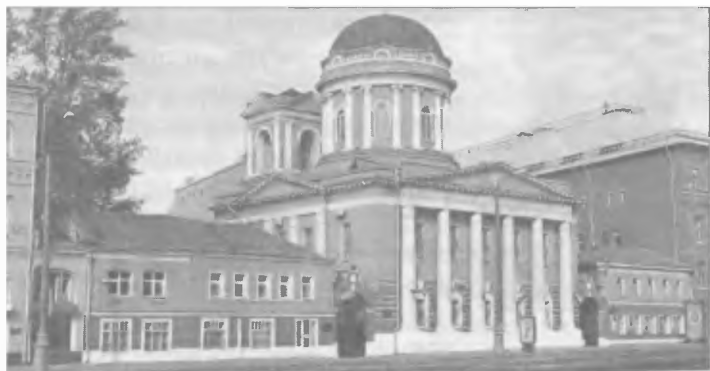
Церковь Иоанна Богослова в Москве (XV в.)

Адашев и его соратники нуждались в новом, молодом и достаточно зависимом от них государе, разделявшем те же идеи, что и Иван IV. Таким кандидатом стал двоюродный брат царя Владимир Андреевич Старицкий, молодой, сильно пострадавший в детстве и от регентши Глинской, и от Шуйских.