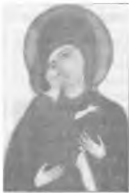
Богоматерь Белозерская (икона, XIII в.)

Шла опасная игра, участники которой перекупали друг у друга сторонников и блефовали. Некоторые бояре предпочли быть подальше от дворца, где могла разгореться братоубийственная война. Владыка Макарий молчал. Сильвестр не показывал явно своей принадлежности к сторонникам Старицкого. К вечеру князя Владимира заставили присягнуть законному наследнику, после нескольких попыток к тому же принудили и его мать. Партия Дмитрия одержала победу, однако борьба не окончилась. Старицкий ждал кончины Ивана IV, чтобы совершить государственный переворот и устранить хотя бы Анастасию с ее родственниками, после чего 15 лет правления ему были бы обеспечены. Он готовил вооруженный захват власти при номинальном